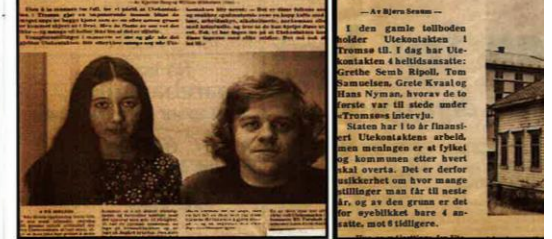
Utekontakten i Tromsø gjør utmerket innsats.